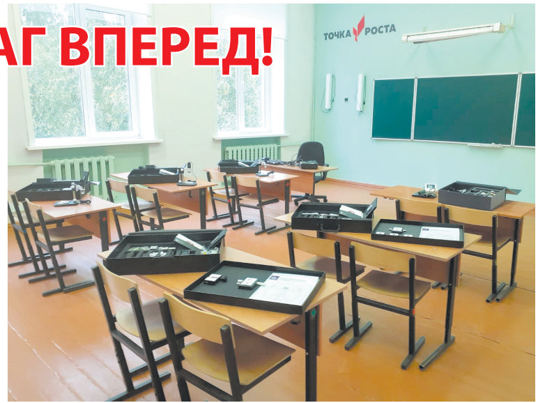
В «Точку роста» Опеченской школы завезли цифровые лаборатории

В планах ребят и педагогов Опеченской средней школы очень