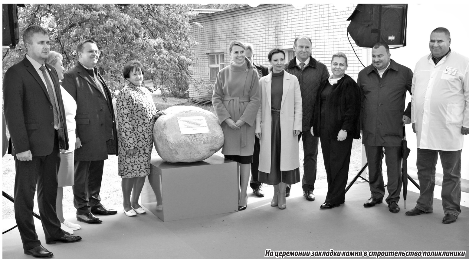
На церемонии закладки камня в строительство поликлиники